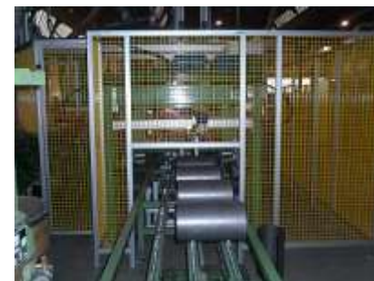
Linea di alimentazione fondi e virole