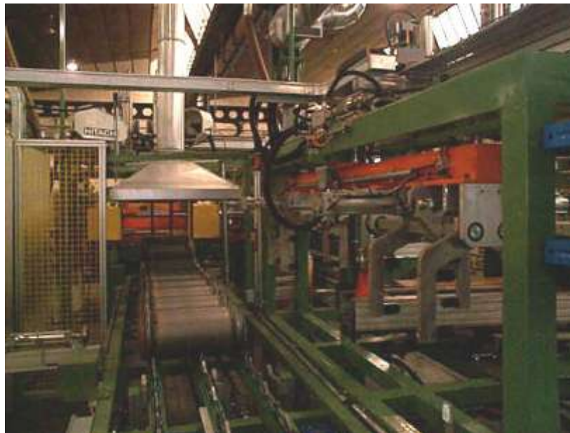
Linea di saldatura e assemblaggio serbatoi