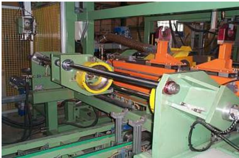
Stazione di accoppiamento fondi con virola