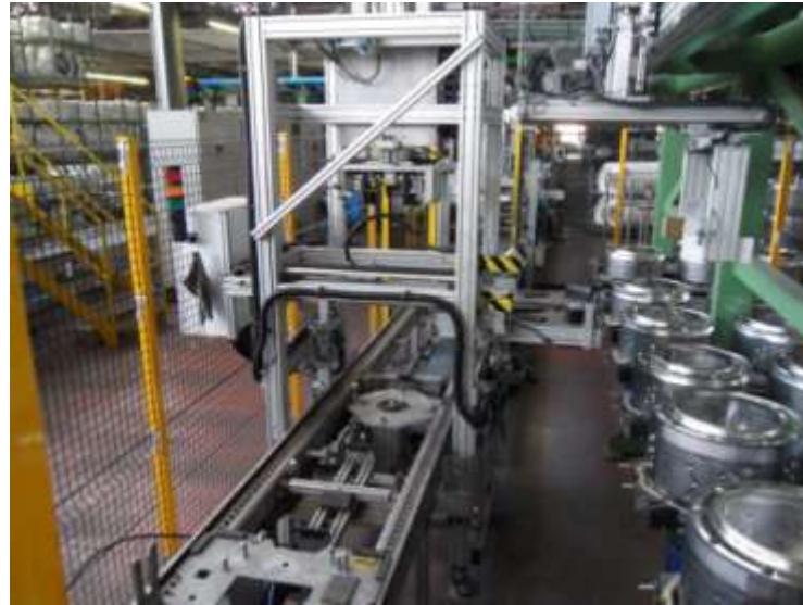
Manipolatori Transfer a 3 assi controllati